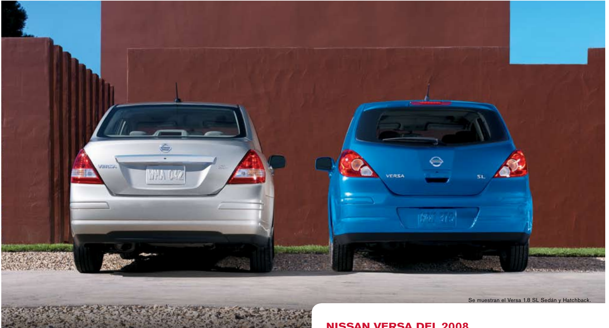
Se muestran el Versa 1.8 SL Sedán y Hatchback.