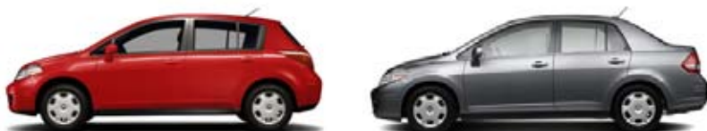
1.8 S: MEJOR DE LO QUE ESPERABAS.