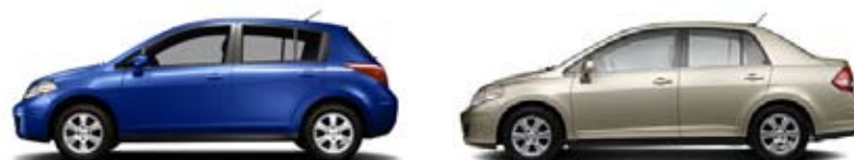
1.8 SL: EL MISMO TAMAÑO, PERO OFRECE MUCHO MAS.